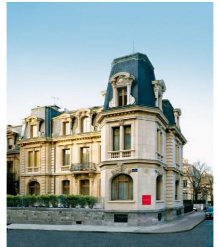
La Fondation Baur, musée des arts d'Extrême-Orient

Situé à la rue Munier-Romilly dans le quartier des Tranchées, il a été acquis peu avant sa mort par le collectionneur suisse Alfred Baur (1865-1951), soucieux de présenter ses collections d'art asiatique au public. Il avait trouvé là le cadre intime qui allait lui permettre de réaliser un musée où les visiteurs « n'auraient pas l'impression d'un musée, mais plutôt d'une maison particulière, où les objets d'art pourraient être examinés à loisir ».