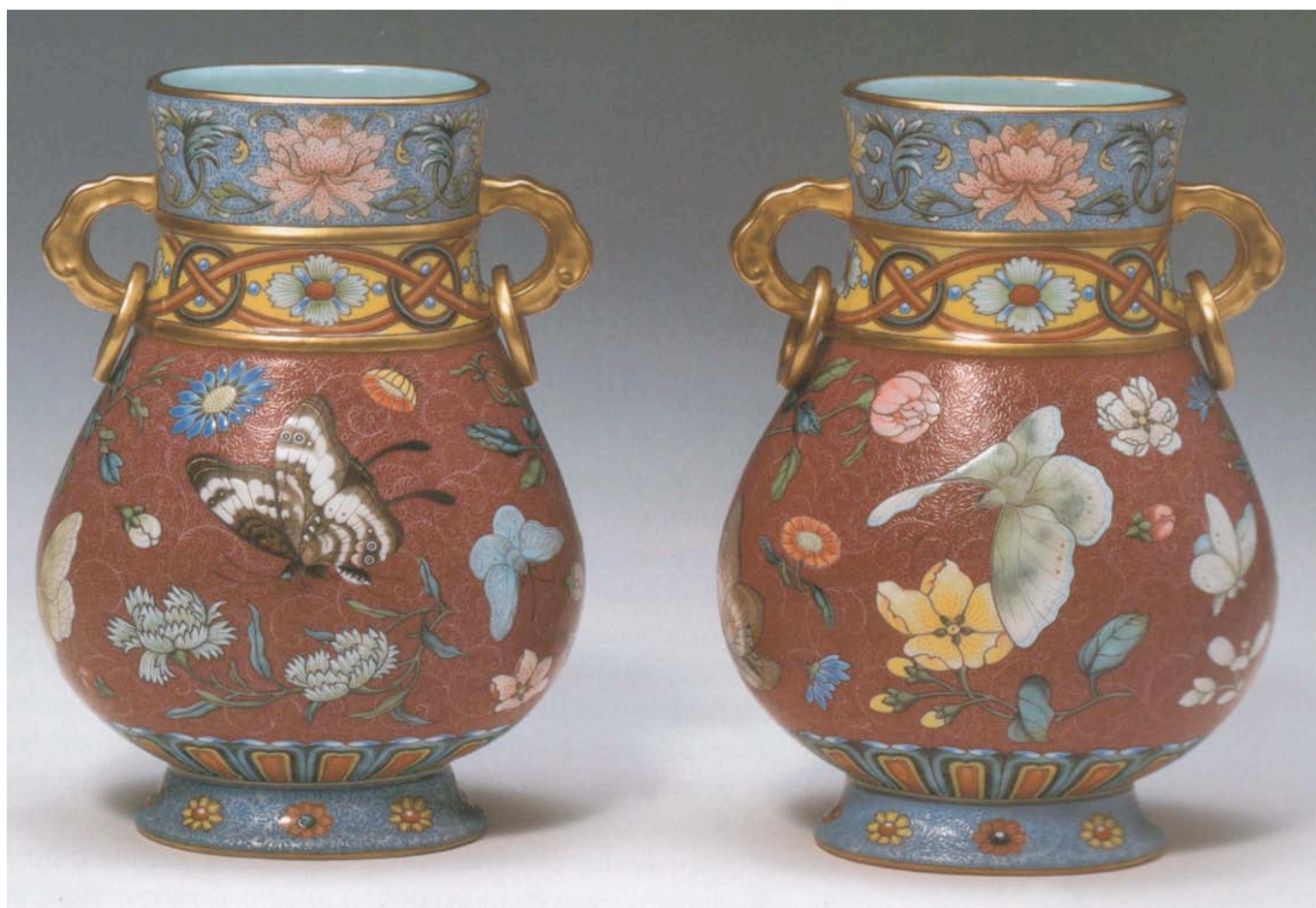
Paire de vases ornés de papillons Porcelaine Dynastie Qing (1644-1911)