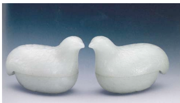
Paire de récipients en forme de cailles Jade Dynastie Qing (1644-1911)

Présentées par paire, les cailles évoquent un « double bonheur », ce qui fait de l'oiseau l'invité incontournable des mariages. D'ailleurs, ce gallinacé est souvent représenté évoluant au milieu d'épis de blé ou de panicules de riz : en Chine, les céréales ou les graines font allusion aux enfants et à la fertilité.