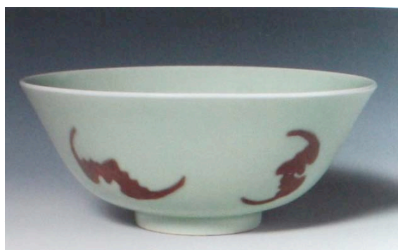
Bol à décor de chauves-souris Porcelaine Dynastie Qing (1644-1911)

En chinois, « chauve-souris » et « bonheur » se prononcent de la même façon. Cette homonymie explique, en partie, pourquoi ce mammifère est, contrairement à la tradition occidentale, un messager de bon augure.