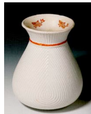
Vase à décor de poissons rouges Porcelaine Dynastie Qing (1644-1911)

Les poissons rouges protègent les membres de la famille contre les mauvais esprits. Créées à partir d'une variété de carpe chinoise, issues de croisements et de sélections, ces « célestes merveilles » aux morphologies et couleurs extraordinaires fascineront, au XVIII e siècle, les Européens, avides d'exotisme. Dans les décors, le poisson rouge pourrait parfois se confondre avec la carpe si cette dernière ne portait toujours deux paires de barbillons, signes d'une force surnaturelle. Cette particularité rappelle que, selon la légende, la carpe serait capable de se transformer en dragon, seul autre animal du bestiaire chinois à arborer ces attributs.