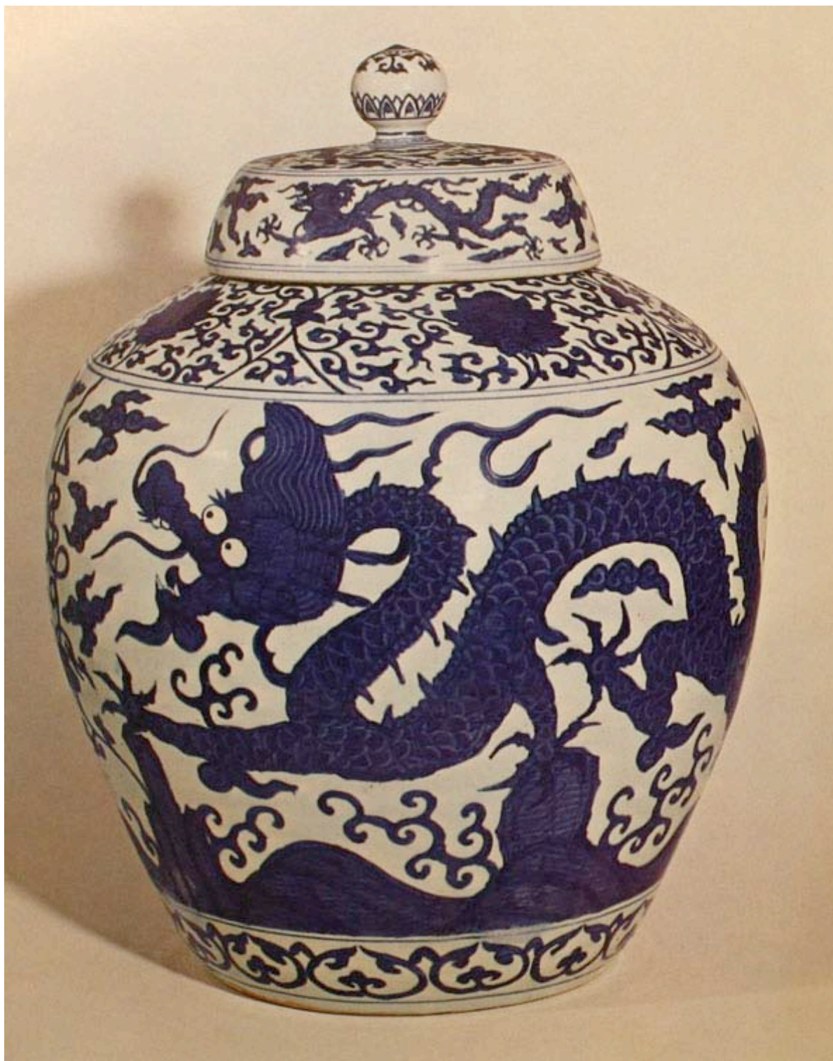
Grande jarre à décor de dragon Porcelaine Dynastie Ming (1368-1644)