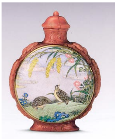
Flacon à tabac à décor de cailles (et pies de l'autre côté) Corail et cuivre Dynastie Qing (1644-1911)