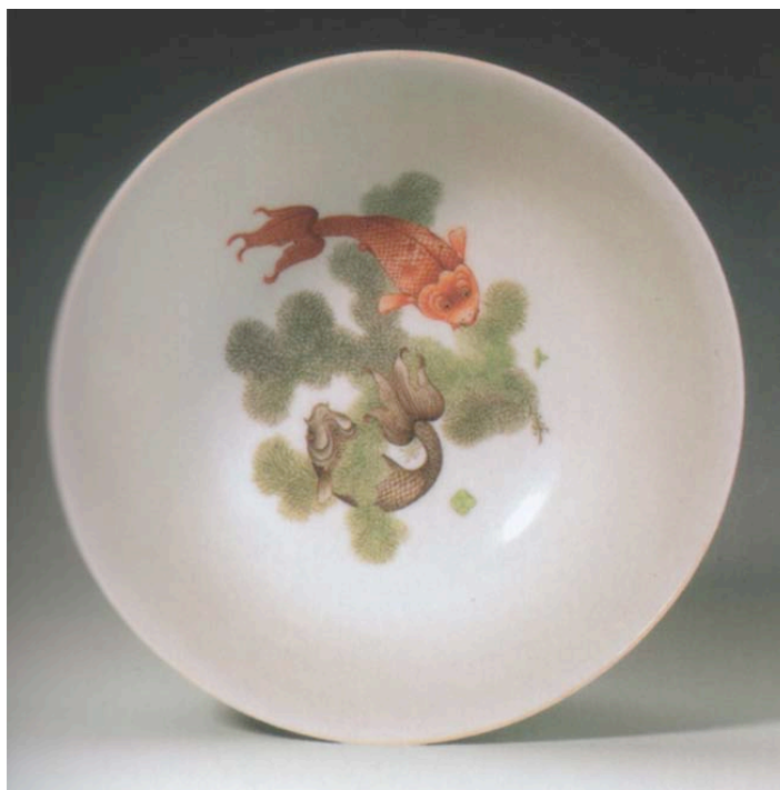
Bol (d'une paire) avec deux poissons se prélassant dans les algues Porcelaine Dynastie Qing (1644-1911)