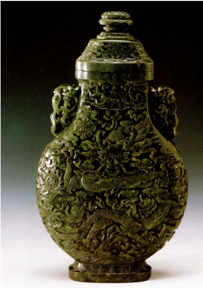
Grande jarre à décor de dragon Porcelaine Dynastie Ming (1368-1644)