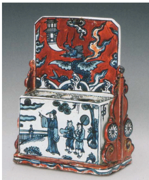
Écran de table, détail de la transformation de la carpe en passant la Porte du Dragon Porcelaine Dynastie Ming (1368-1644)