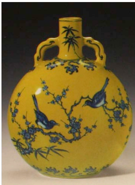
Bouteille en forme de lune et à décor de pies Porcelaine Dynastie Qing (1644-1911)