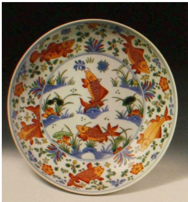
Plat (d'une paire) décoré de plusieurs espèces de poissons Porcelaine Dynastie Qing (1644-1911)