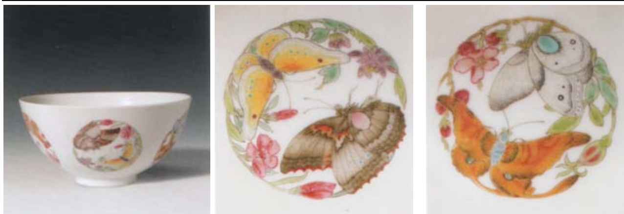
Bol à décor de papillons, détails de certains médaillons Porcelaine Dynastie Qing (1644-1911)