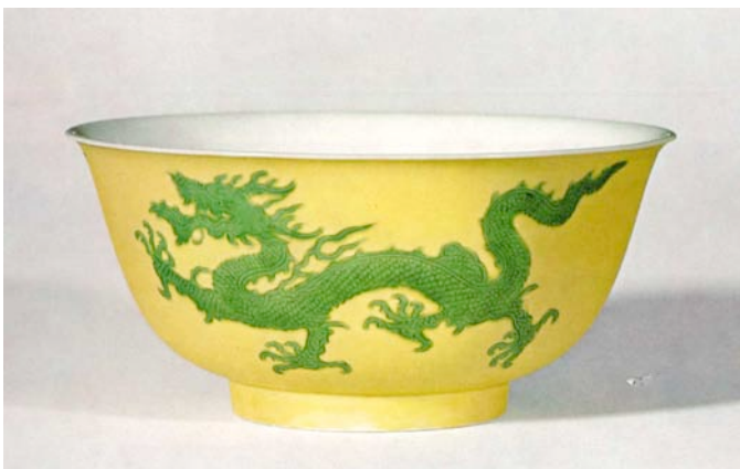
Bol à décor de dragons Porcelaine Dynastie Qing (1644-1911)