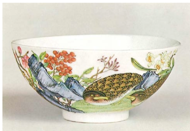
Bol à décor de cailles Porcelaine Dynastie Qing (1644-1911)