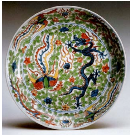
Plat orné d'un dragon et d'un phénix Porcelaine Dynastie Ming (1368-1644)

Le dragon est, sans conteste, la créature la plus prestigieuse de la mythologie chinoise. Doté de pouvoirs extraordinaires, il peut voler parmi les nuages ou vivre dans les eaux, changer de taille, disparaître ou prendre l'apparence d'un autre animal pour passer incognito. Maître des éléments naturels, il ordonne au vent de souffler et déclenche la pluie. À la fois craint et respecté, le dragon protège des mauvaises influences et porte bonheur.