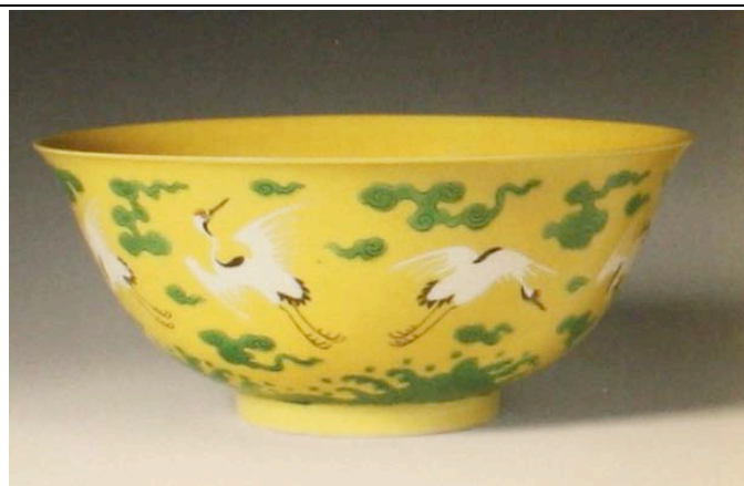
Bol à décor de grues Porcelaine Dynastie Qing (1644-1911)